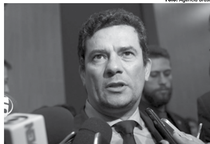
Ministro da Justiça Sérgio Moro para quem ganhar ou perder é parte do jogo

Um pouco antes, os deputados haviam aprovado o texto base da MP 870/19, que