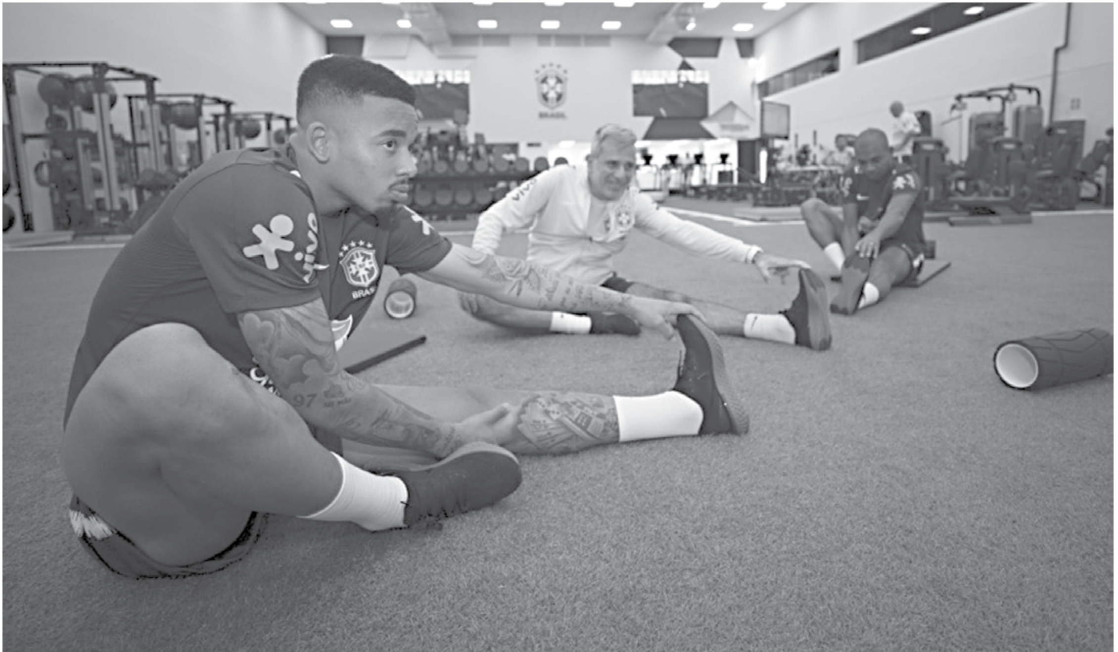
Gabriel Jesus treina na academia da Granja Comary para fortalecer a musculatura no início dos trabalhos da Seleção Brasileira visando a disputa da Copa América. Antes, a equipe fará amistosos contra o Catar e Honduras