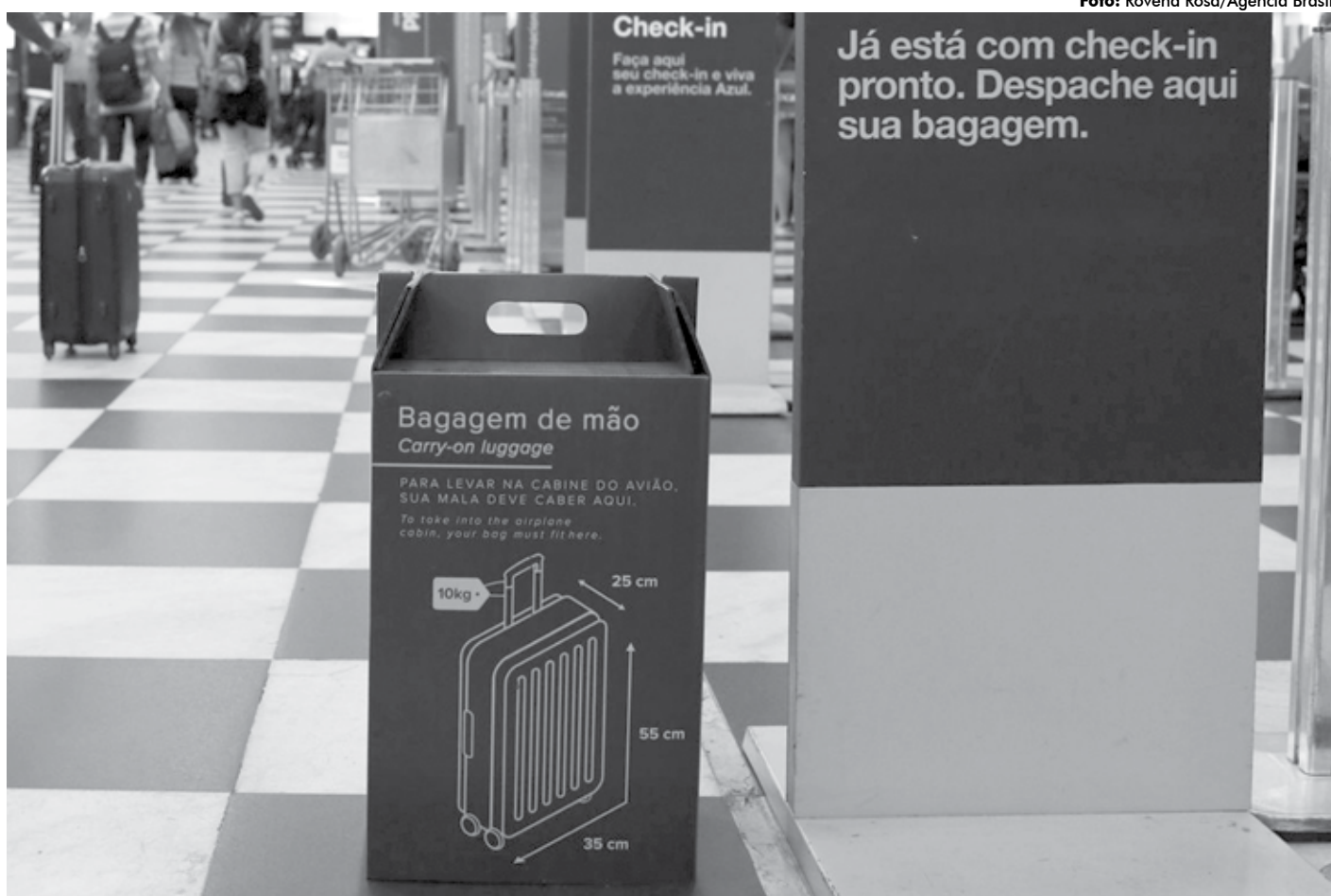
Malas fora do padrão devem ser despachadas obrigatoriamente, passageiros em dúvida já encontram nos aeroportos as bagagens de tamanho real (foto)