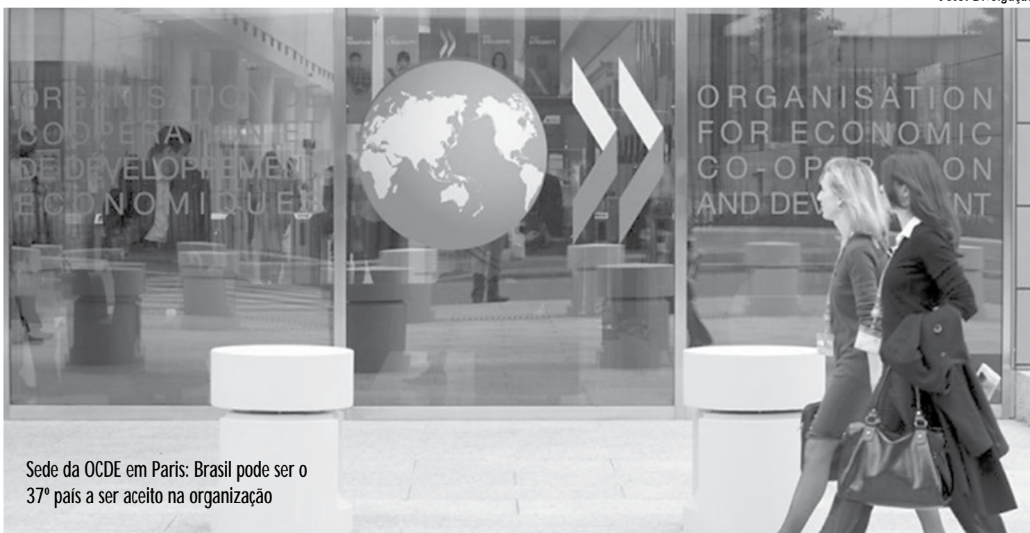
Sede da OCDE em Paris: Brasil pode ser o 37º país a ser aceito na organização

O apoio dos EUA, segundo Araújo, é “importantíssimo nesse nosso caminho para nos tornarmos membros