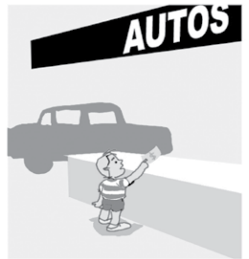
- EU QUERO UMA CAMINHONETA 4 x 4!