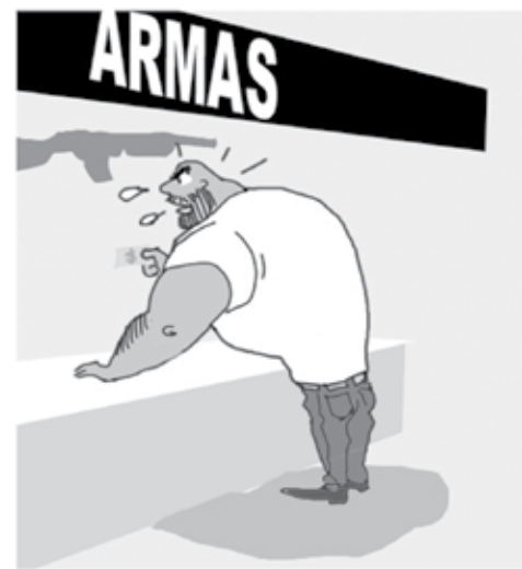
- EU QUERO UM FUZIL SEMI AUTOMÁTICO!

CONTATOS: uniaoovpb@gmail.com REDAÇÃO: (83) 3218-6539/3218-6509