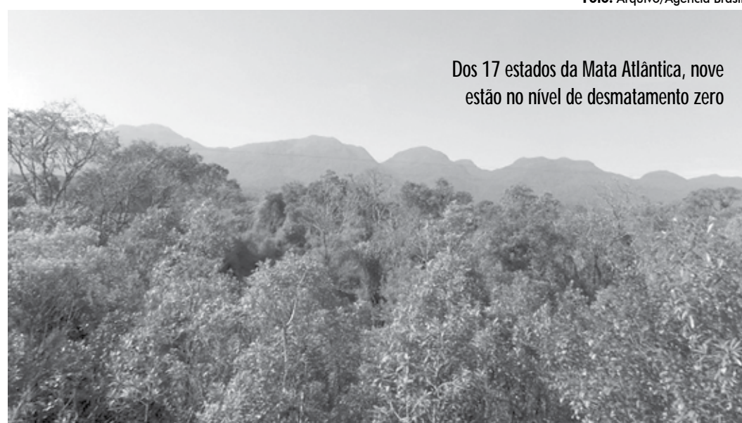
Dos 17 estados da Mata Atlântica, nove estão no nível de desmatamento zero

Esses nove estados são o Ceará (7 ha), Alagoas (8 ha), o Rio Grande do Norte (13 ha), Rio de Janeiro (18 ha), Espírito Santo (19 ha), a Paraíba (33 ha), Pernambuco (90 ha), São Paulo (96 ha) e Sergipe (98 ha). Mais três estados estão se apro-